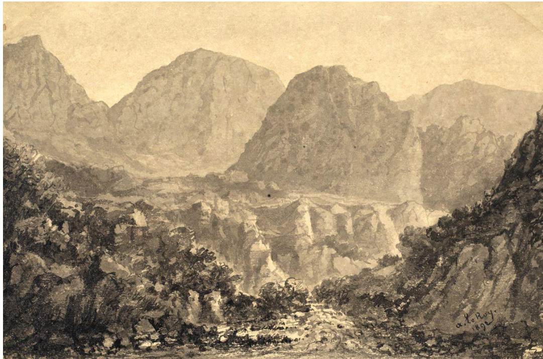
Le Piton d'Anchaing en 1875 (Musée Leon Dierx)